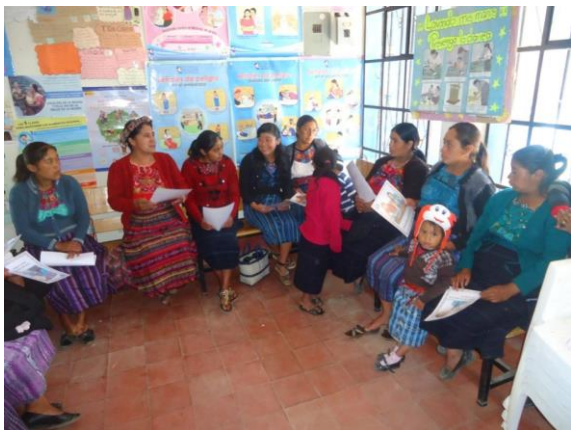
Guatemala, CODECOT: atelier sur les signes de danger durant la grossesse, l'accouchement et le post-partum, mai 2018