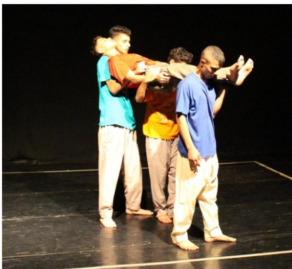
Palestine, Yes Theatre: une pièce réalisée par des jeunes ex-détenus, à destination d'autres jeunes de la communauté, octobre 2018.