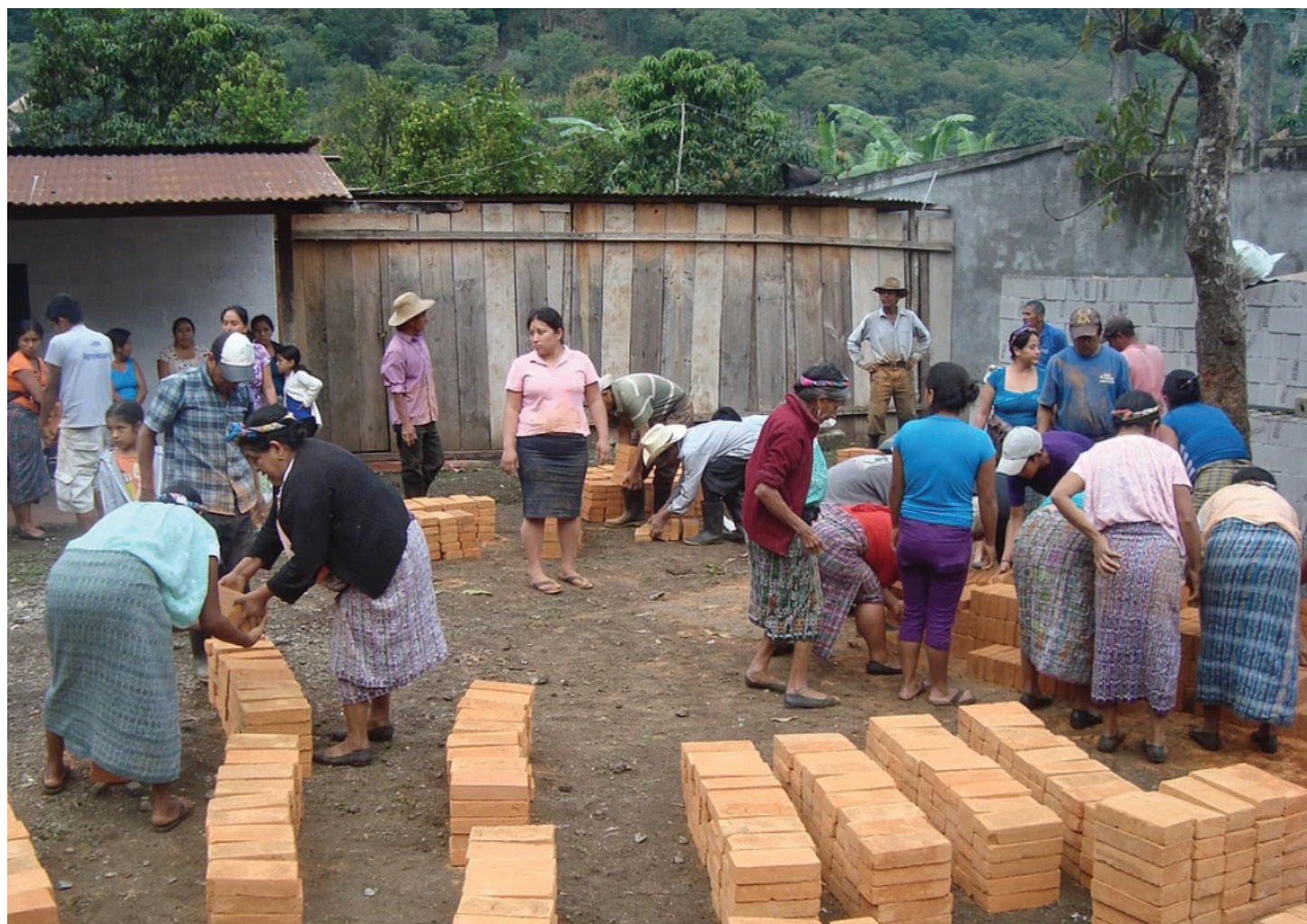
Réception des briques pour la construction des fours écologiques dans le département de Huehuetenango, Guatemala, en 2015

Centrale Sanitaire Suisse Romande ENGAGÉE POUR LA SANTÉ !