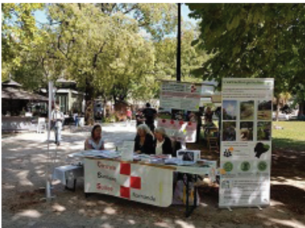
A l'occasion du festival Alternatiba, la CSSR a présenté son projet en Equateur, septembre 2019.