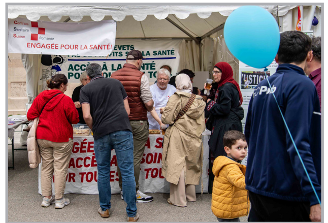
Photo: Premier mai 2024, stand de la CSSR

Comme chaque année, la CSSR a activement participé au rendez-vous syndical genevois du 1 er mai ainsi qu'au festival